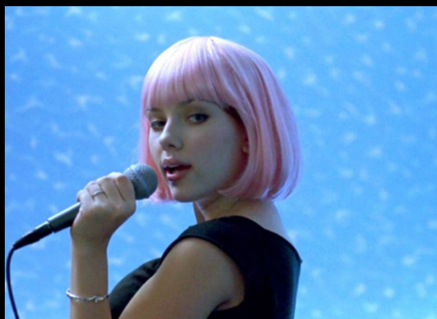
"Lost in translation" de Sofia Coppola