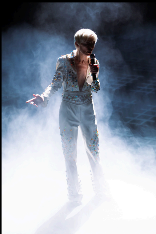
"La réunification des deux Corées" de Joël Pommerat