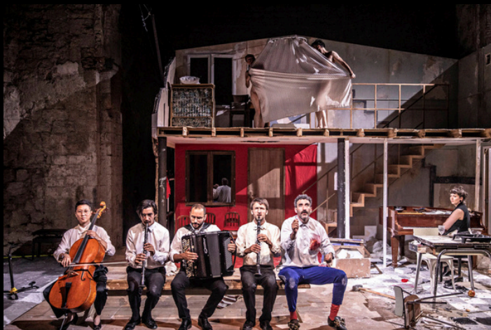
"Sans tambour" de Samuel Achache