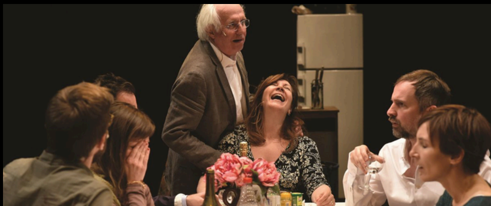
"Tout le monde ne peut pas être orphelin" des Chiens de Navarre